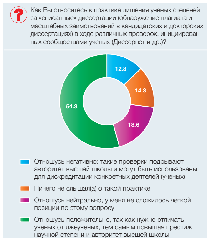
Рис. 3. Отношение преподавателей вузов к практике лишения ученых степеней за «списанные» диссертации (в процентах от общей численности ответивших преподавателей)

работах части текста из других работ без ссылок на авторов (30%); скачивание из интернета рефератов, эссе, курсовых и других работ (27%) (рис. 4).