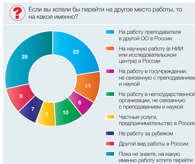
Рис. 5. Предпочтения преподавателей относительно новой работы в случае ухода из вуза (в процентах от численности штатных преподавателей вузов, желающих сменить работу)

товы легко сменить ее на другую преподаватели частных вузов.