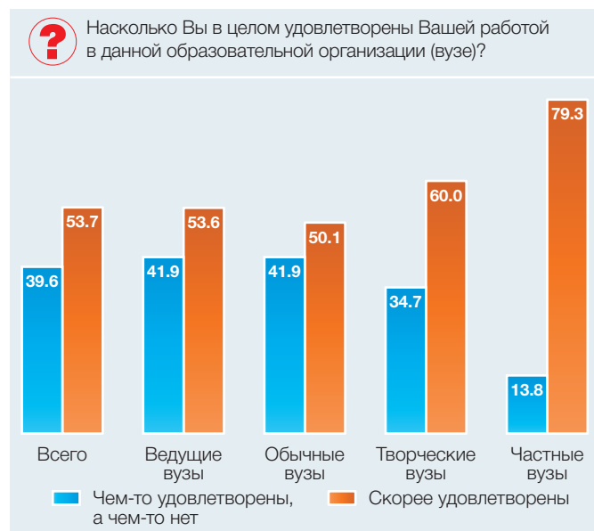
Рис. 2. Уровень удовлетворенности работой преподавателей по типам вузов (в процентах от общей численности ответивших преподавателей)

вузов: они согласны сменить работу при заработной плате 136 тыс. руб. в месяц (в обычных вузах – 90 тыс. руб.). Легче всего готовы расстаться со своей профессией представители частных вузов – за заработную плату 60 тыс. руб. (рис. 3).