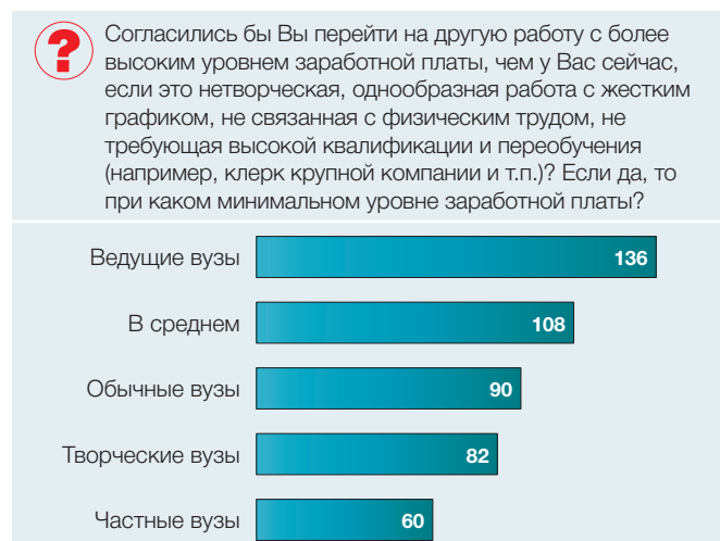
Рис. 4. Готовность преподавателей перейти с работы в данном вузе на какую-либо другую работу или вообще перестать работать (в процентах от общей численности ответивших преподавателей)