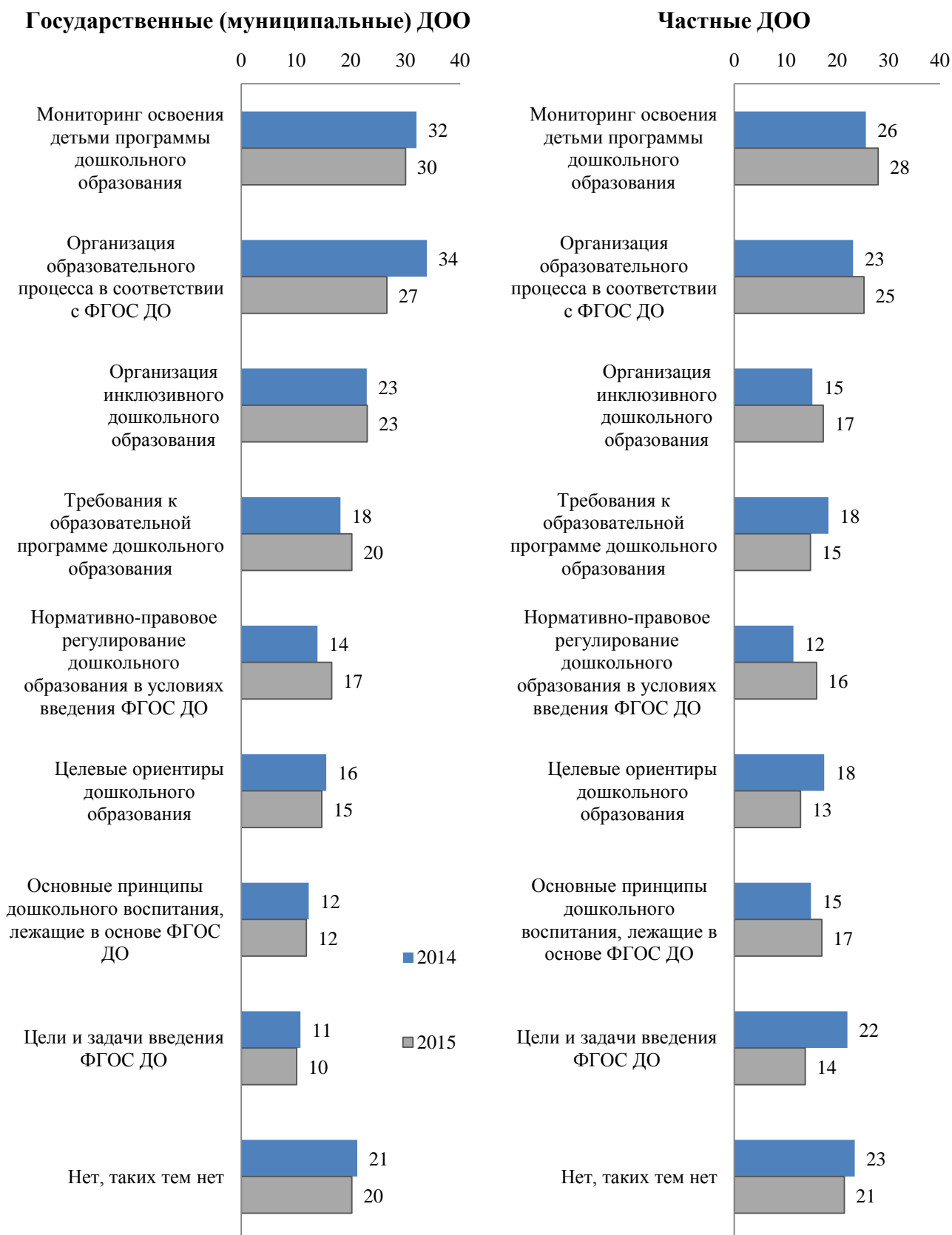
Рисунок 2 – Доля воспитателей, желающих узнать больше о различных аспектах ФГОС ДО, % от работающих в государственных и частных ДОО

Вопрос: Есть ли какие-либо темы, связанные с ФГОС ДО, о которых Вы бы хотели узнать больше?