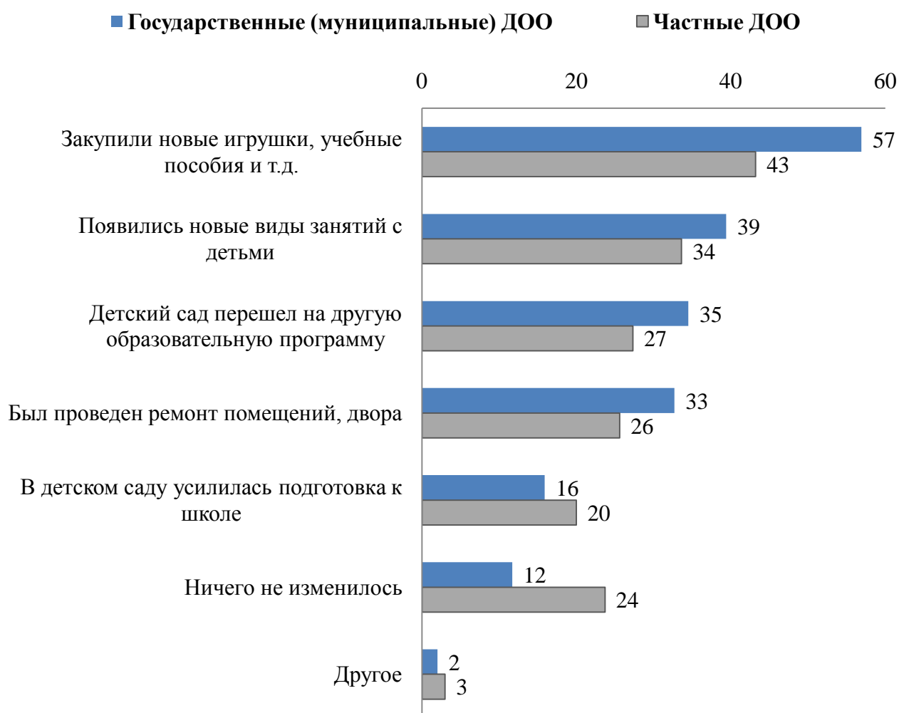
Рисунок 3 - Результаты введения ФГОС ДО по мнению воспитателей государственных и частных ДОО, 2016 год

Вопрос: Изменилось ли что-либо в Вашем детском саду после введения федерального государственного образовательного стандарта дошкольного образования (ФГОС ДО)?