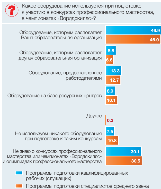
Рис. 3. Использование оборудования при подготовке студентов к конкурсам (олимпиадам) профессионального мастерства или в чемпионатах «Ворлдскиллс» (в процентах от общей численности опрошенных)

по программам подготовки квалифицированных рабочих она составила 8%, а среди будущих специалистов среднего звена – 10% (рис. 3).