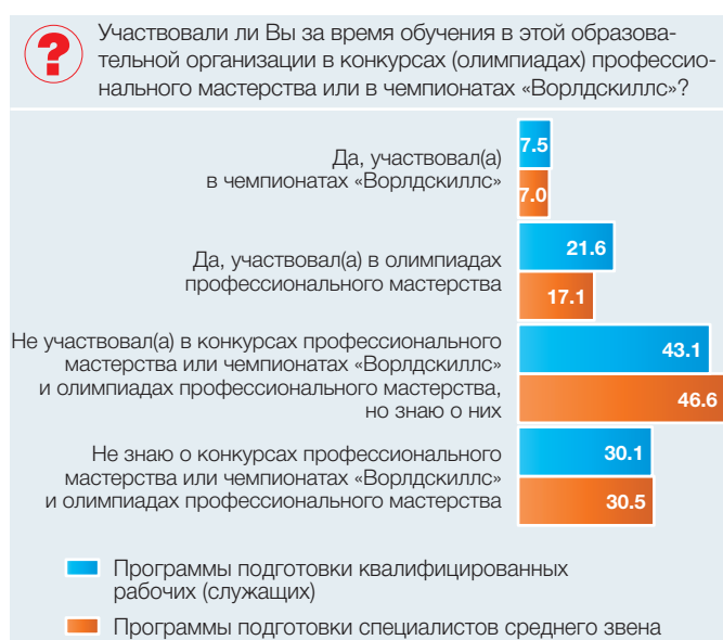
Рис. 1. Участие студентов в конкурсах (олимпиадах) профессионального мастерства или в чемпионатах «Ворлдскиллс» (в процентах от общей численности опрошенных)

По результатам опроса, около 70% студентов, обучающихся массовым профессиям и специальностям СПО, осведомлены о существовании движения «Ворлдскиллс» и конкурсах (олимпиадах) профессионального мастерства; 22% студентов программ подготовки квалифицированных рабочих (служащих) и 17% обучающихся по программам подготовки специалистов среднего звена принимали участие в олимпиадах профессионального мастерства; чуть больше 7% опрошенных студентов также участвовали в профессиональных чемпионатах «Ворлдскиллс» (рис. 1).