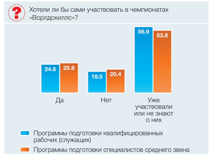
Рис. 4. Планы студентов по участию в конкурсах (олимпиадах) профессионального мастерства или в чемпионатах «Ворлдскиллс» (в процентах от общей численности опрошенных)

Согласно опросу, среди студентов массовых профессий и специальностей СПО, которые знают о существовании конкурсов (олимпиад) профессионального мастерства или чемпионатов «Ворлдскиллс», но еще не участвовали в них, немногим более половины (56,2%) хотели бы в них принять участие (рис. 4). Такие результаты свидетельствуют о том, что наряду с задачей базового информирования студентов о существовании движения «Ворлдскиллс», существует необходимость широкого освещения преимуществ подготовки и участия в профессиональных конкурсах.