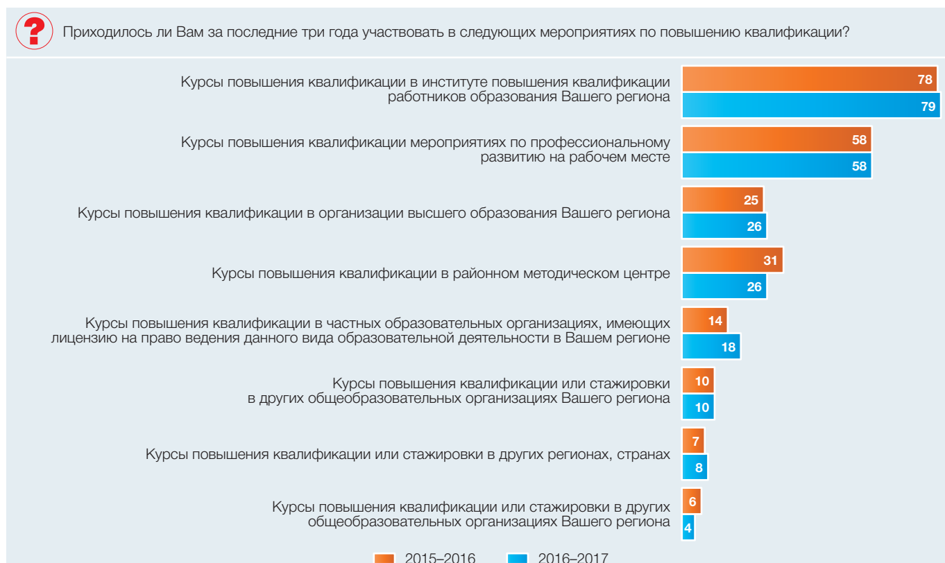
Рис. 2. Основные формы профессионального развития учителей: 2015–2016, 2016–2017 учебные года (в процентах от численности ответивших учителей общеобразовательных организаций)

Среди наиболее популярных причин посещения курсов повышения квалификации учителя называют потребность ознакомиться с современными методами преподавания своего предмета (60%), углубление знаний в основной предметной области/областях (58%). Однако этот пункт как профессиональный дефицит зафиксировали лишь 5% респондентов.