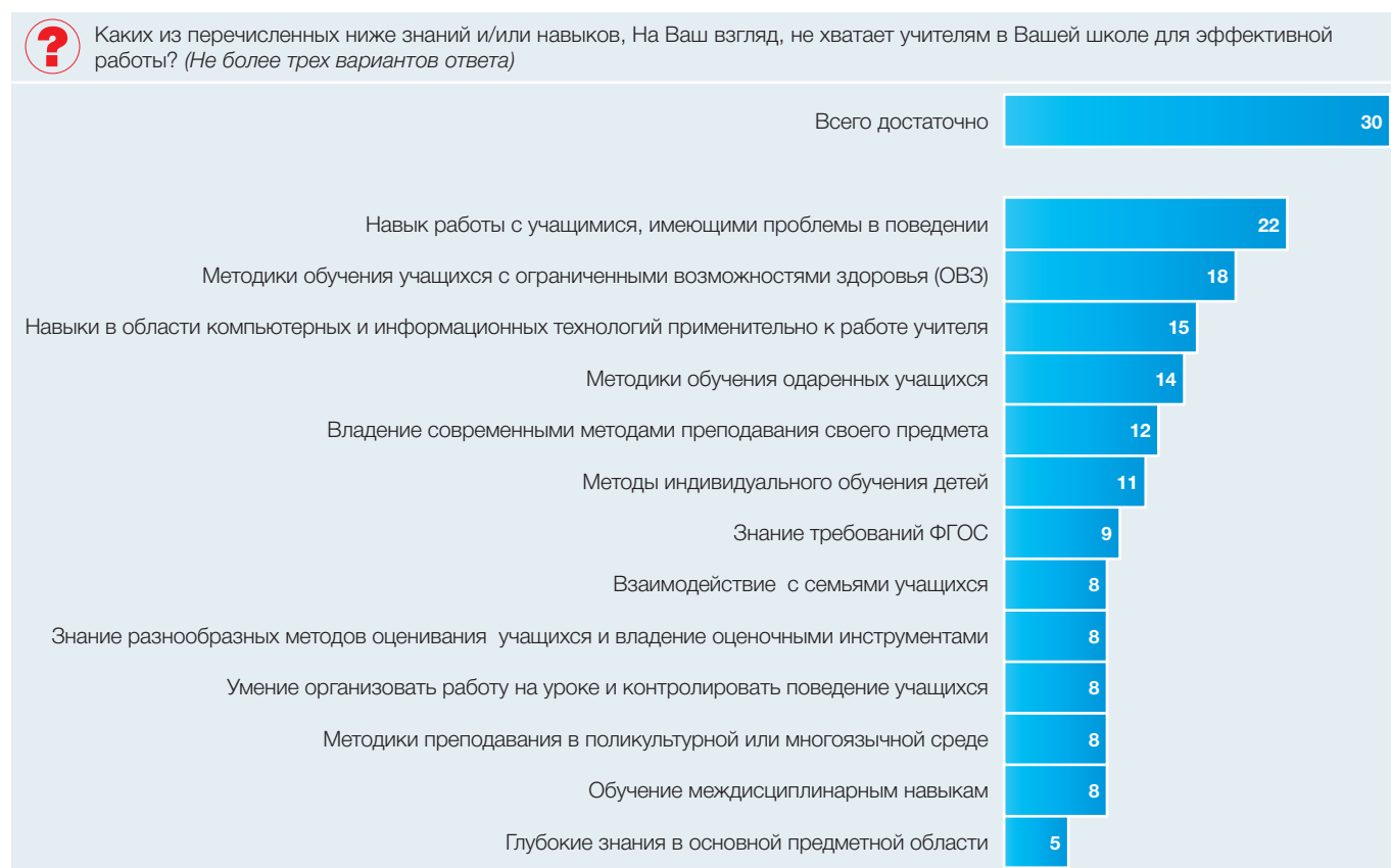
Рис. 1. Дефициты профессиональных навыков, которые отмечают учителя: 2016–2017 учебный год (в процентах от численности ответивших учителей общеобразовательных организаций)

По сравнению с распределением ответов в прошлом году доля учителей, которые отметили собственные профессиональные дефициты, выросла