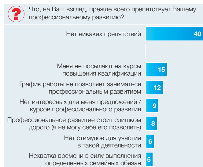
Рис. 4. Основные препятствия для профессионального развития по мнению самих учителей: 2016–2017 учебный год (в процентах от численности ответивших на вопрос учителей общеобразовательных организаций)

Обращает на себя внимание увеличение доли учителей, отмечающих наличие препятствий в профессиональном развитии (следует учитывать, что лишь 112 респондентов смогли ответить на этот вопрос). Если в предыдущем году половина опрошенных преподавателей (54%) указали, что ничто не препятствует их профессиональному развитию, то, согласно данным опроса 2016 года, доля таких учителей снизилась до 40% от общего числа респондентов (рис. 4).