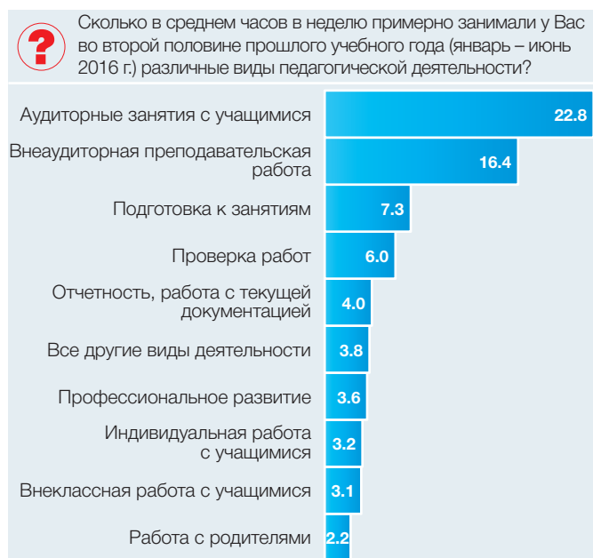
Рис. 7. Время, уделяемое педагогами различным видам профессиональной деятельности, 2016/17 уч. г. (часов в неделю)

За последние три года все больше учителей отмечают отсутствие собственного внимания и внимания администрации школы к работе с родителями и семьями обучающихся (рис. 8).