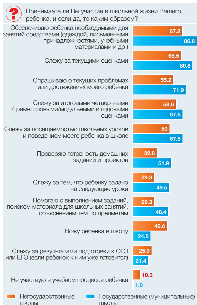
Рис. 4. Виды участия родителей в учебном процессе их детей в зависимости от формы собственности, 2016/17 уч. г. (в процентах от численности ответивших родителей школьников)

щий индекс. Для расчета индекса каждому варианту ответа присвоено целочисленное значение весового коэффициента от 0 – самое редкое обращение до 5 – самое частое обращение с шагом в 1 единицу. Индекс рассчитан как отношение суммы произведений весовых коэффициентов на долю выбравших соответствующий ответ к максимально возможному значению суммы. Диапазон возможных значений индекса: от 0 до 1.