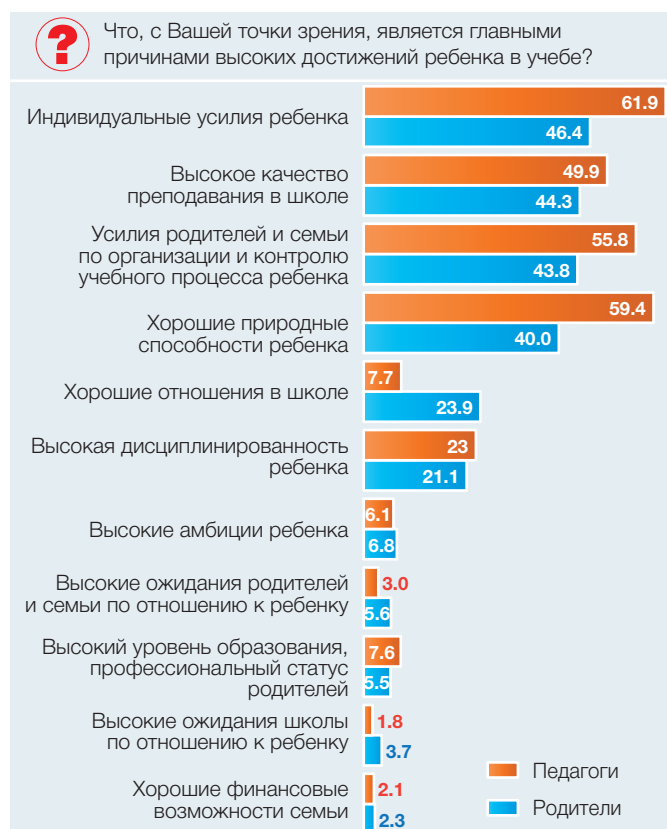
Рис. 1. Оценка родителями и педагогами причин высоких достижений школьников, 2016/17 уч. г. (в процентах от численности ответивших)

Родители детей, обучающихся в негосударственных школах, проявляют большую инициативу. Они в 1,5–2 раза чаще вносят предложения по вопросам развития школы, организации учебного процесса и внеурочной деятельности (рис. 2). Однако доля таких родителей остается невысокой (около 10–12%).