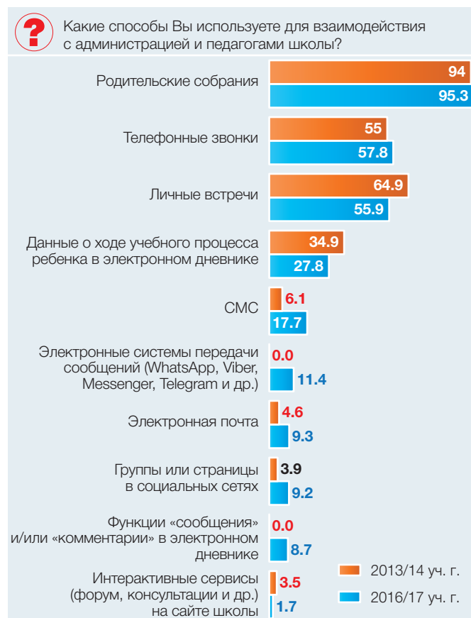
Рис. 6. Частота обращения родителей к различным видам коммуникации по поводу учебного процесса, 2016/17 уч. г. индекс (max=1)