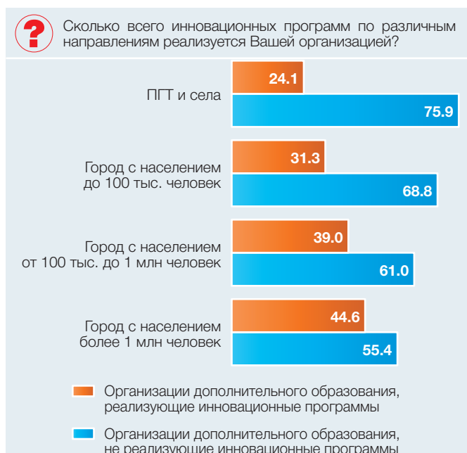
Рис. 5. Реализация инновационных программ в населенных пунктах разной величины: 2016 (в процентах от общей численности опрошенных руководителей)

ниже в городах с населением меньше 100 тыс. человек, поселках городского типа (ПГТ) и селах (рис. 5).