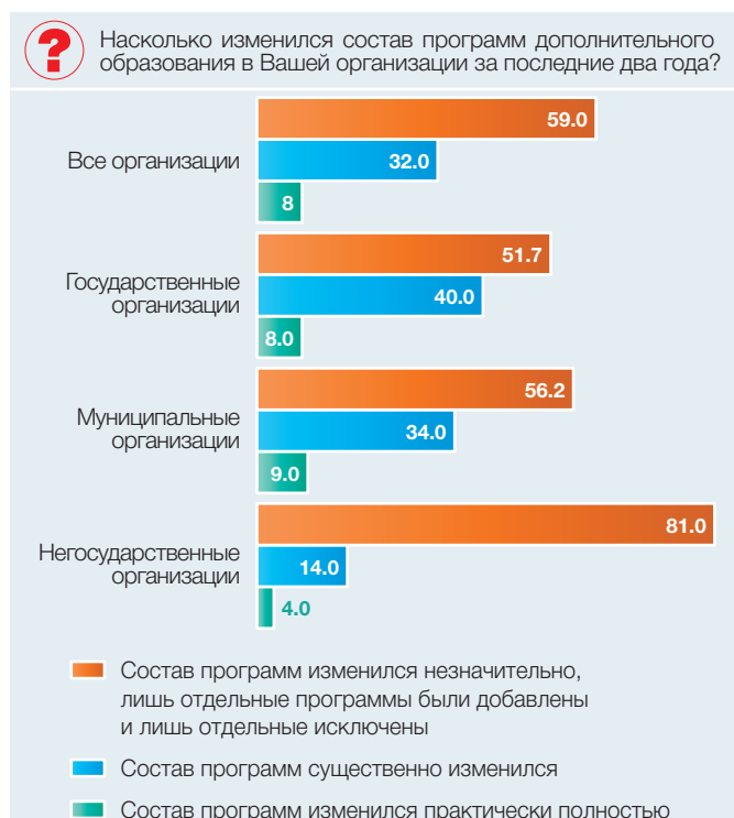
Рис. 1. Обновление спектра реализуемых программ дополнительного образования детей по формам собственности образовательной организации: 2016 (в процентах от общей численности опрошенных руководителей)