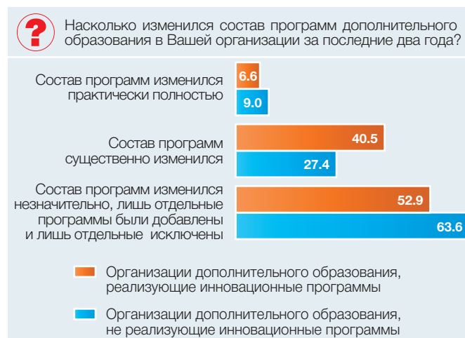
Рис. 3. Обновление состава дополнительных общеобразовательных программ в организациях, реализующих инновационные образовательные программы: 2016 (в процентах от общей численности опрошенных руководителей)

Как показывают результаты опроса, значительным фактором обновления состава предлагаемых программ служит реализация организацией дополнительного образования инновационных образовательных программ. В тех организациях, которые отнесли себя к реализующим инновационные образовательные программы, состав программ меняется чаще: о существенном или почти полном изменении программ за последние два года заявила почти половина из них, в то же время среди организаций, не предлагающих инновационные программы, таких чуть более трети (рис. 3).