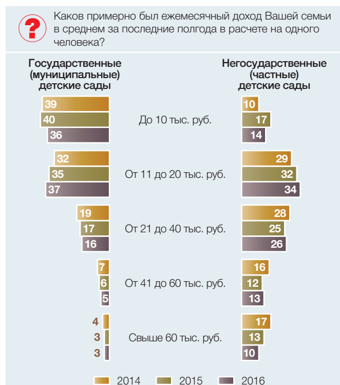
Рис. 1. Средний ежемесячный доход на одного человека в семьях, где дети посещают детские сады (в процентах от численности ответивших родителей)

Что касается частных детских садов, то доля семей с ежемесячным доходом на одного члена семьи до 10 тыс. руб. в 2016 г. также снизилась и составила 14% против 17% в 2015 г. Доля семей, где доходы не превышают 20 тыс. руб. на человека, выросла с 32 до 34%, более 60 тыс. руб. – сократилась до 10%