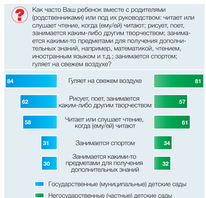
Рис. 5. Виды деятельности, которыми дети, посещающие детские сады, чаще всего занимаются с родителями: 2016 (в процентах от численности ответивших родителей)

в сельской местности и ПГТ, реже, чем в других населенных пунктах, занимаются спортом со своими родителями (20%).