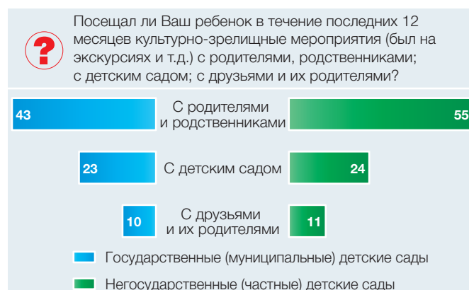
Рис. 3. Посещение ребенком культурно-зрелищных мероприятий: 2016 (в процентах от численности ответивших родителей)

Чаще всего родители с детьми дошкольного возраста посещают театры, музеи, выставки, зоопарк,