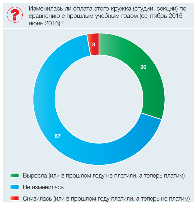
Рис. 4. Изменение в оплате занятий по сравнению с прошлым учебным годом: 2016 (в процентах от численности ответивших родителей)

получение ими новых навыков и компетенций, которые могут быть полезны при обучении по основной образовательной программе и для последующей профессиональной карьеры. Родители из малообеспеченных и, в особенности, социально неблагополучных семей чаще довольствуются обеспечением времяпрепровождения и досуга для ребёнка. Соответственно, первые склонны отдавать детей в негосударственные и частные организации, а вторые чаще удовлетворяются бесплатными предложениями в государственных и муниципальных организациях.