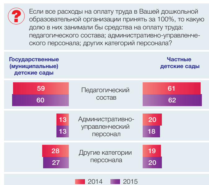
Рис. 1. Структура расходов на оплату труда в государственных (муниципальных) и частных детских садах по результатам опросов руководителей (в % от общего объема расходов на оплату труда)

управленческий персонал в государственных (муниципальных) детских садах в среднем составляют около 13% от общих расходов на оплату труда. В частном секторе дошкольного образования доля расходов на административно-управленческий персонал несколько выше по сравнению с государственными (муниципальными) детскими садами. В государственных (муниципальных) детских садах, в свою очередь, выше доля расходов на другие категории персонала.