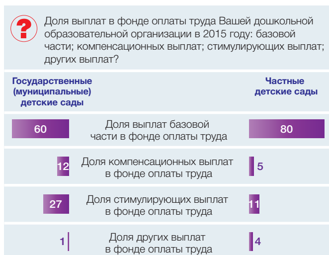
Рис. 4. Основные выплаты в фонде оплаты труда в государственных (муниципальных) и частных детских садах по результатам опросов руководителей (2015 год, средние значения в%)

В частном секторе дошкольного образования 80% фонда оплаты труда составляли средства, обеспечивающие покрытие базовой части выплат заработной платы работников частных детских садов (см. рис. 4). Остальные средства направлялись на стимулирующую часть выплат (11%) и компенсационные выплаты (5%). В большинстве частных детских садов заработная плата педагогов определяется базовой частью за выполнение должностных инструкций, а не стимулированием.