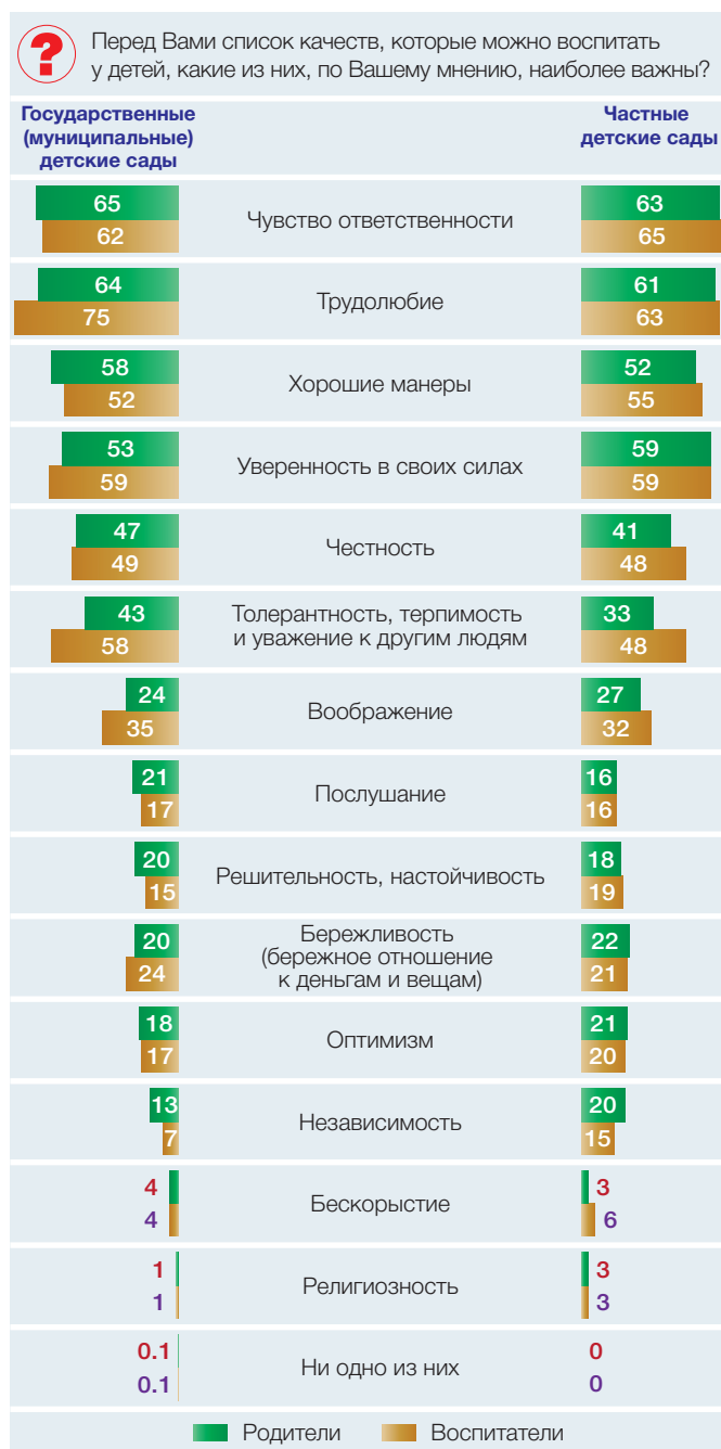
Рис. 3 Важные качества, которые можно воспитывать у детей, по мнению родителей и воспитателей государственных (муниципальных) и частных детских садов, 2015/2016 учебный год (% ответивших воспитателей и родителей дошкольников, посещающих детские сады)

уважение к другим людям – 43% и воспитание честности у ребенка – 47% относительно родителей дошкольников частных детских садов, соответственно 33% и 41%. Для родителей детей, посещающих частные детские сады, наиболее важным качеством является воспитание уверенности в своих силах (59%) и независимости (20%). Напротив, большая часть родителей, дети которых посещают государственные (муниципальные) детские сады, выбирает трудолюбие по сравнению с родителями детей из частных детских садов, соответственно 64% против 61%.