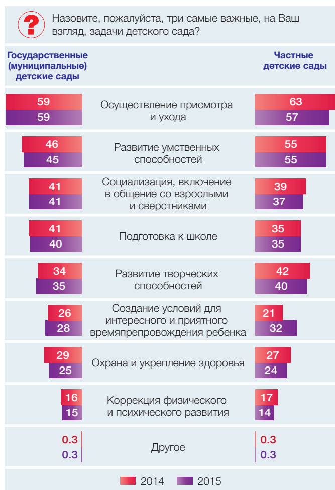
Рис. 1. Самые важные задачи государственного (муниципального) и частного детского сада (% ответивших родителей дошкольников, посещающих детские сады)