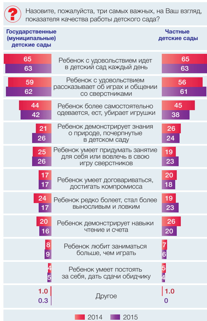
Рис. 2. Наиболее важные показатели качества работы государственного (муниципального) и частного детского сада (% ответивших родителей дошкольников, посещающих детские сады)

лей и воспитателей детских садов по качествам, которые можно воспитывать у детей, отмечаются как в государственных (муниципальных), так и в частных детских садах. К наиболее распространенным, которые находятся в шести верхних строках рейтинга ответов родителей и воспитателей, относятся: чувство ответственности, трудолюбие, хорошие манеры, уверенность в своих силах, честность и толерантность. А также по набору последних трех мест – религиозность, бескорыстие, независимость.