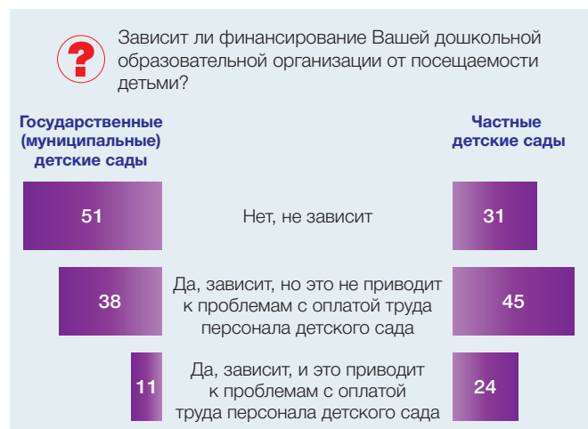
Рис. 3. Финансирование от посещаемости детей в государственных (муниципальных) и частных детских садах, 2015 г. (в % от численности ответивших руководителей)

пополнение штата квалифицированными педагогическими кадрами. При этом отмечают низкие темпы материально-технического обеспечения дошкольных организаций для образовательных целей, в частности электронной техникой и учебным оборудованием.