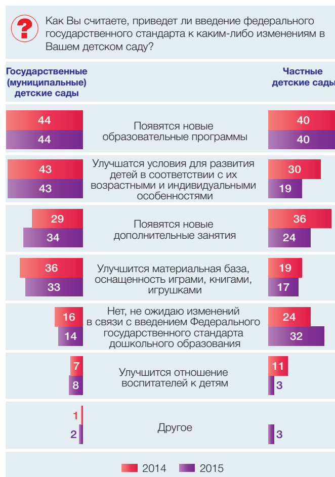
Рис. 5. Изменения в работе детского сада, которых ожидают родители в связи с введением ФГОС ДО, государственные (муниципальные) и частные детские сады (в % от численности осведомленных о введении ФГОС ДО родителей)

ными и индивидуальными особенностями, улучшение материальной базы и реализацию новых дополнительных занятий.