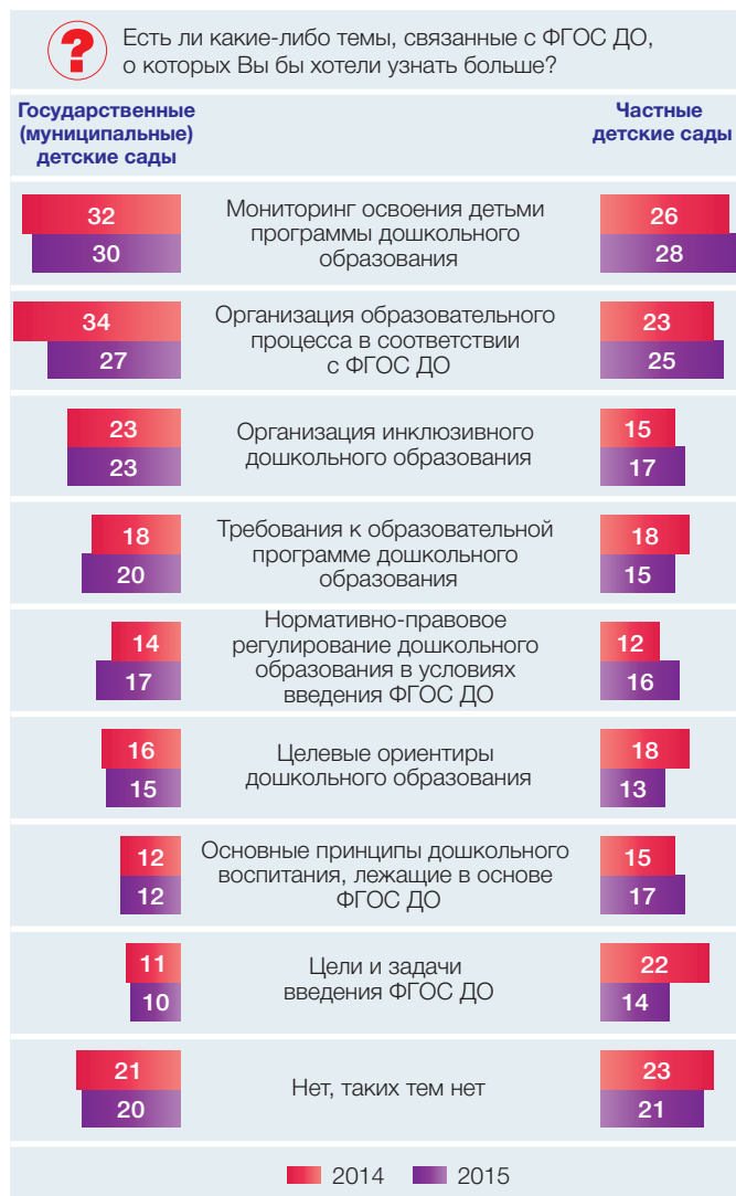
Рис. 2. Доля воспитателей, желающих узнать больше о различных аспектах ФГОС ДО, в государственных (муниципальных) и частных детских садах (в % от численности ответивших воспитателей)