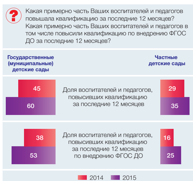
Рис. 1. Доля воспитателей и педагогов государственных (муниципальных) и частных детских садов, которые повышали квалификацию по внедрению ФГОС ДО (в % от численности ответивших руководителей)

Около четверти воспитателей и педагогов частных детских садов также участвовали в программах повышения квалификации по внедрению ФГОС ДО, однако уровень их участия в данных мероприятиях существенно ниже по сравнению с государственными (муниципальными) детскими садами.