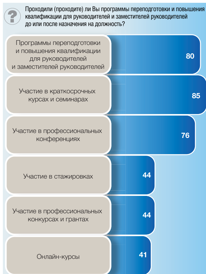
Рис. 5. Участие руководителей образовательных организаций в программах переподготовки и повышения квалификации: опрос директоров (в процентах от численности опрошенных)

вовлечены в профессиональные конкурсы и гранты (49% против 43% в обычных школах).