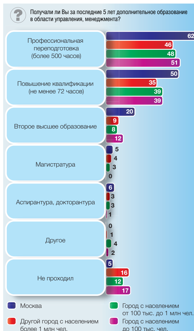
Рис. 2. Участие руководителей образовательных организаций в получении дополнительного образования в области управления, менеджмента по типам населенных пунктов: опрос директоров (в процентах от численности опрошенных)

Среди директоров частных школ процент охвата программами профессиональной переподготовки (32%) и повышения квалификации (33%) значительно ниже, чем в государственных (муниципальных) шко-