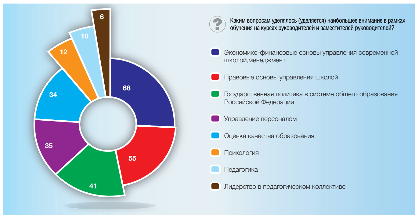
Рис. 11. Основные темы, обсуждаемые в рамках обучения на курсах руководителей и заместителей руководителей (в процентах от численности ответивших)

стаж директора общеобразовательной организации сегодня составляет более 20 лет, административный стаж – почти 10 лет 3 ) и на сегодняшний день потеряло свою актуальность. А если учесть, что директора (особенно в крупных городах) стремительно теряют педагогическую нагрузку, их компетентность в вопросах преподавания и обучения снижается еще больше. Отсутствие в содержании подготовки директоров вопросов школьного лидерства противоречит современным тенденциям развития образования и может стать серьезным барьером для успешной реализации федерального государственного образовательного стандарта.