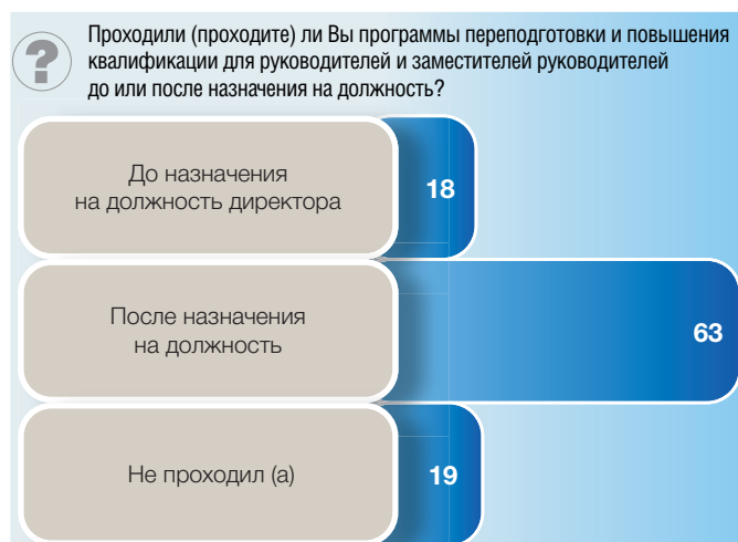
Рис. 8. Участие руководителей образовательных организаций в программах переподготовки и повышения квалификации по времени прохождения: опрос директоров (в процентах от численности опрошенных)