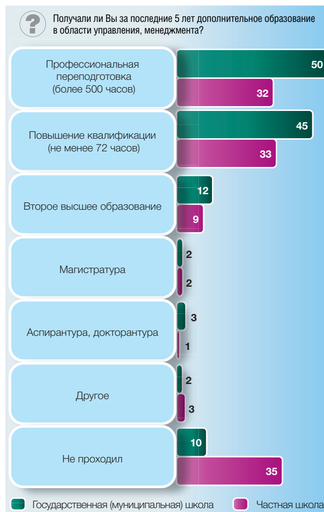
Рис. 4. Участие руководителей образовательных организаций в получении дополнительного образования в области управления, менеджмента по формам собственности образовательных организаций: опрос директоров (в процентах от численности опрошенных)

директора участвуют значительно реже (40–44%), чем в традиционных курсах и семинарах.