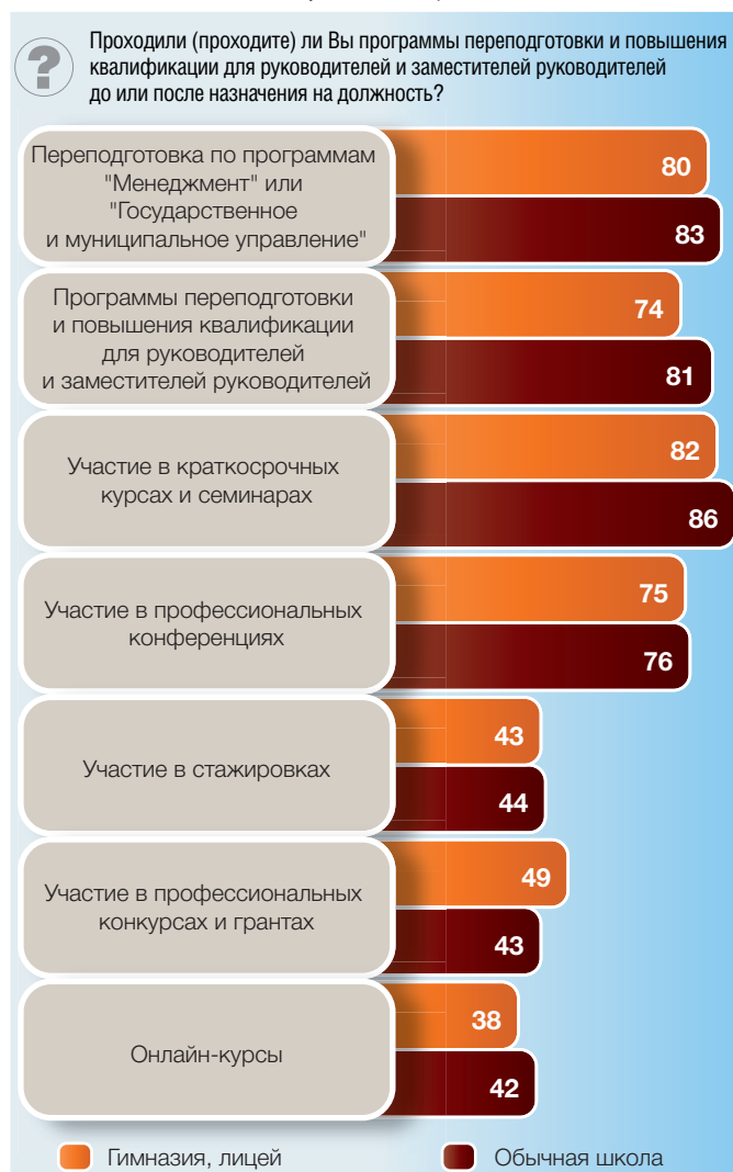
Рис. 8. Участие руководителей образовательных организаций в программах переподготовки и повышения квалификации по времени прохождения: опрос директоров (в процентах от численности опрошенных)