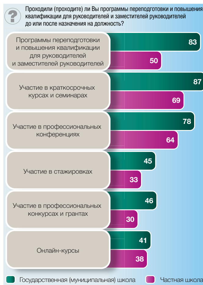
Рис. 6. Участие руководителей образовательных организаций в программах переподготовки и повышения квалификации по формам собственности образовательных организаций: опрос директоров (в процентах от численности опрошенных)

жения законодательства, связанные с расширением самостоятельности образовательной организации и повышением ее эффективности. По данным опроса, основное внимание при обучении директоров уделяется вопросам экономики и финансов (68% времени), права (55%), государственной образовательной политики (41%), управления персоналом (35%) (рис. 11).