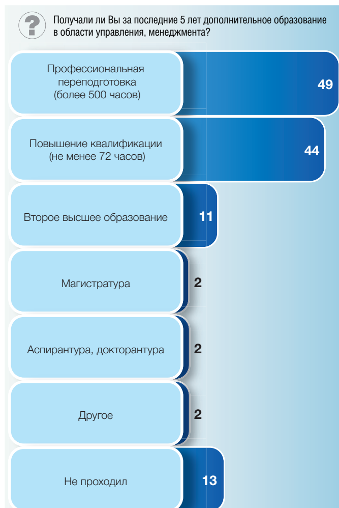
Рис. 1. Участие руководителей образовательных организаций в получении дополнительного образования в области управления, менеджмента: опрос директоров (в процентах от численности опрошенных)

тот факт, что наибольшая доля директоров, не получавших дополнительное образование в области управления, менеджмента, – в городах с населением до 100 тыс. чел. (17%) и от 100 тыс. до 1 млн чел. (16%) (рис. 2).