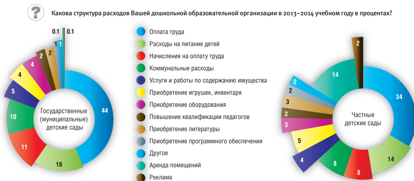
Рис. 2. Структура расходов дошкольных образовательных организаций: опрос руководителей (в среднем, в процентах)

Развитию частных детских садов в большей степени препятствуют лицензионные требования к наличию и численности кадров, слишком высокая для родителей плата, законодательные сложности.