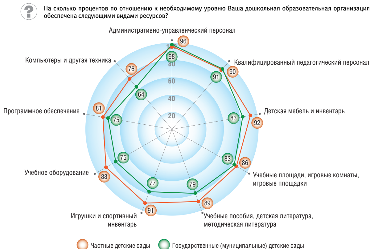
Рис. 4. Обеспеченность дошкольных образовательных организаций ресурсами: опрос руководителей (в среднем, в процентах)

ских садов. Уровень обеспеченности спортивным залом заметно ниже – немногим более 50% (в столице данный показатель существенно выше). При этом плавательный бассейн имеют в Москве только четверть детских садов, в других городах – 10–15%, а на селе – 3–5%. Такая ситуация неблагоприятно сказывается на физическом развитии детей. Однако следует отметить, что бассейны не были включены в нормативы обеспеченности, поэтому не предусматривались в проектах типовых зданий дошкольных образовательных организаций (в частности в силу дороговизны и сложности в эксплуатации).