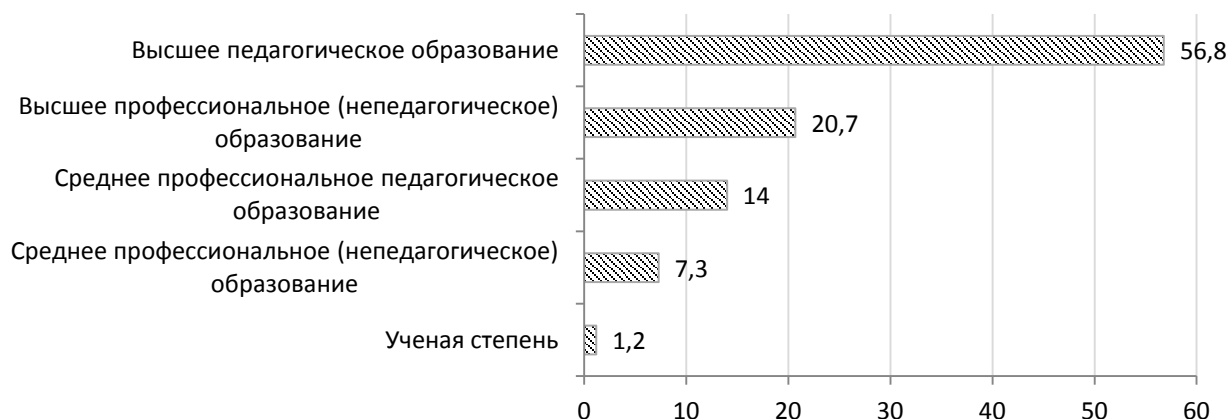
Рисунок 3. Структура педагогических кадров учреждений дополнительного образования (по уровню и специфике профессионального образования) (Ответы руководителей УДОД, 2012 г., %)

Закономерно, что наибольшее число педагогов с высшим педагогическим образованием работают в УДОД системы образования, самое большое число педагогов со средним профессиональным образованием, в т.ч. педагогическим, – в УДОД культуры. Вполне объяснимой является наблюдаемая в ответах руководителей взаимосвязь числа педагогов с высшим образованием и размером населенного пункта: чем крупнее город, тем больше педагогов имеют высшее и высшее педагогическое образование (за исключением соотношения городов с населением более 1 млн. чел. и до 1 млн. чел.). Интересным представляется сравнение профессиональной квалификации педагогов в УДОД различных типов и форм собственности. Так, доля педагогов с высшим профессиональным образованием выше в учреждениях с более высоким уровнем самостоятельности и активной маркетинговой политикой (в автономных УДОД – 82,9% и негосударственных организациях – 84,2%). В свою очередь, в казенных УДОД значения данных показателей ниже.