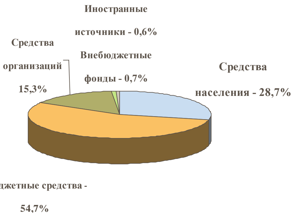
Рис. 1. Структура средств государственных высших учебных заведений по источникам финансирования (в %): 2009г. 6

За последние 20 лет в нашей стране существенно изменился механизм финансирования образования - Россия отошла от модели государственного финансирования, которая сложилась в Советском Союзе. В 2009г. бюджетные средства в структуре средств государственных высших учебных заведений составляли только 54,7%, а в структуре средств негосударственных вузов – 0,5%. Одновременно произошел стремительный рост привлечения университетами денежных средств населения. Этот источник финансирования составляет 28,7% для государственных и 91,1% для негосударственных высших учебных заведений (рис. 1 и 2).