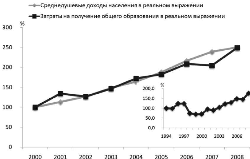
Рис. 2 Динамика фактических затрат в расчете на одного ребенка, связанных с получением общего (школьного) образования, в реальном выражении (2000 г. = 100 %; на вспомогательном графике: 1994 г. = 100 %) 6