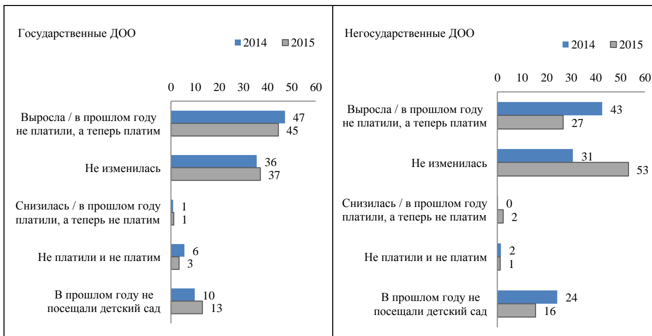
Рисунок 2 – Изменения родительской платы относительно прошлого учебного года для государственных и частных детских садов

Чаще всего в государственных (муниципальных) дошкольных образовательных организациях (далее – ДОО) наблюдалась тенденция к росту размера родительской платы, как в 2014 году, так и в 2015 году (Рисунок 2). В 2014 году большинство опрошенных (43%) отметили, что родительская плата в частных детских садах росла, но в 2015 году рост родительской платы отмечают только 27% родителей. Более половины опрошенных родителей детей из частных детских садов в 2015 году отметили, что родительская плата не изменилась за это время.